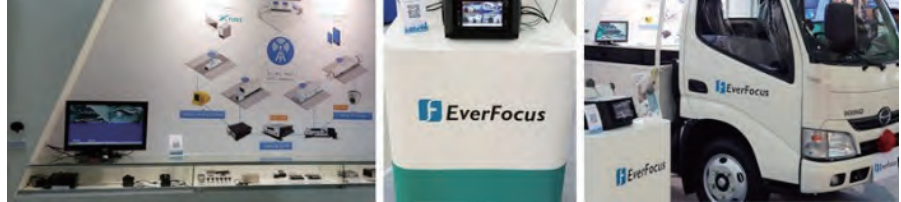
圖5：慧友電子現場展示大型車輛行車視野輔助系統(左)及Xfleet智能車隊管理系統(右)，呈現實際操作與應用實例，提供全面性解決方案。

慧友電子在車載電子產品具有多年經驗，2017年第4季成功進入日系商用車市場。2018展示大型車輛行車視野輔助系統及最新規格車用DVR。透過左右兩側車外攝影鏡頭，並由顯示螢幕提供駕駛車輛行駛時周邊路面影像之視野輔助與左右轉提示，幫助駕駛察覺更多視線死角，減少意外事故。其中EMV車用DVR系列中的EMV1200 FHD與EMV400S FHD更是榮獲2018台灣精品獎的肯定。