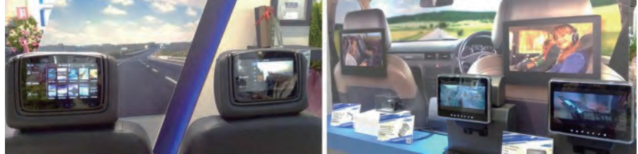
圖2：凱銳光電「EVO後座娛樂系統」(左)榮獲台北國際車用電子展創新產品獎(電子終端產品及零組件類)銀牌獎。右為最新的車用娛樂系統林肯系列。

凱銳光電「EVO後座娛樂系統」是由Multi-core processor及車聯網(IoV)在車載娛樂系統上極致應用發揮，使用者可將影音透過USB/ SD Card/ HDMI/ MHL/ Wi-Fi/ DLNA傳送至EVO觀賞，或透過EVO的Multicast將影音同步傳送至平板及手機觀看，在配有4G/LTE功能的車上也可以連上網際網路看直播串流。EVO已通過歐、美、日、中等國車用安全法規，目前已打入福特、GM等車廠。另外會場也展示與日本車用電子Tier One合作開發的Connected DVR，並成功打入日本三大車廠。