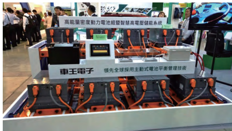
圖4：車王電子展示「高能量密度動力電池組暨智慧高電壓儲能系統」，領先全球採用主動式電池平衡管理技術。

神達數位「行動裝置管理系統MiDM」專屬雲端控制台，得以直接對行動裝置進行軟體管理。不論是能夠透過雲端監控系統，進行應用軟體和操作的更新與管理、優化移動通信網絡功能及安全性、即時追蹤裝置設備之位置以及遠端故障排除支持等功能，都讓企業有更高的生產力，提升服務品質之效率。