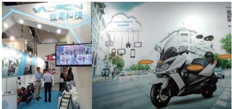
圖7：馥鴻科技展示VACARON CLOUD、機車行車紀錄器、1080P車用監控系統及車隊追蹤管理系統。

車威視展出包括車載專用液晶顯示器、耐候性攝影機、數位行車影像紀錄儀、車隊管理核心軟體系統等全系列產品。此外，全新進化1080P車用DVR，帶領車用DVR跨入HD世代，並與技術產業合作單位針對ADAS(先進駕駛輔助系統)建置，演示展出LDWS(車道偏移警示系統)、FCWS(前車碰撞警示系統)與AVM(360度環景系統)。