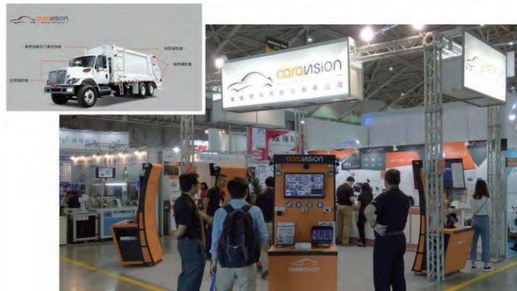
圖6：車威視caravision，秉持「Moving Intelligence」精神，致力打造安全穩定、操作簡單的车載專用影像產品。

慧友電子在車載電子產品具有多年經驗，2017年第4季成功進入日系商用車市場。2018展示大型車輛行車視野輔助系統及最新規格車用DVR。透過左右兩側車外攝影鏡頭，並由顯示螢幕提供駕駛車輛行駛時周邊路面影像之視野輔助與左右轉提示，幫助駕駛察覺更多視線死角，減少意外事故。其中EMV車用DVR系列中的EMV1200 FHD與EMV400S FHD更是榮獲2018台灣精品獎的肯定。