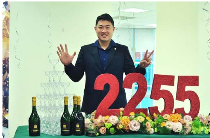
▲車載娛樂系統凱銳光電於11月30日以每股25元正式登錄興櫃，股票代號2255。

車載娛樂系統凱銳光電於11月30日以每股25元正式登錄興櫃，股票代號2255，主辦承銷商為台新證券。