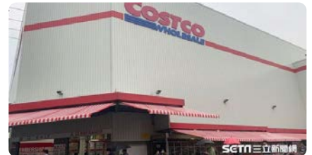
偷幫會員續約？好市多員工：請用力罵